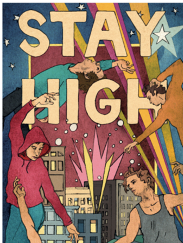
MIKA & YASMINE FOR THE RITE OF SPRING MIKA REDONNE DES COULEURS À PARIS AVEC LA COMPLICITÉ DU MUSÉE DES ARTS DÉCORATIFS ET DE LA VILLE DE PARIS

L'illustration et les arts visuels ont toujours été au centre du travail du chanteur-compositeur MIKA. C'est une volonté de « contextualiser sa musique dans un monde visuel précis » qui a conduit MIKA à collaborer avec sa sœur Yasmine sur des pochettes d'albums et des campagnes d'affichage ; une collaboration qui dure depuis plus de 20 ans. Depuis leur premier travail sur le premier album de MIKA, qui s'est vendu à plusieurs millions d'exemplaires, Life In Cartoon Motion , s'est largement poursuivi, le couple avec leur propre studio de trois personnes basé à Miami, a travaillé sur 8 sorties d'albums différents, 7 tournées mondiales, des collaborations de produits allant de Swatch, Pilot Pens, Lotus, Coca Cola entre autres. Une partie moins connue des activités de l'artiste, mais une partie fondamentale de son processus créatif et de son identité artistique.