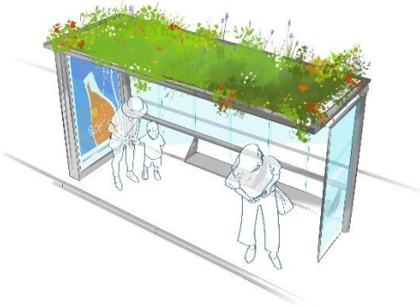
Abribus avec toit végétalisé

quant à eux, l'introduction de plantes grimpantes telles que le chèvrefeuille et le jasmin. Cette combinaison florale rythmera les saisons, transformant le moment d'attente en une agréable parenthèse olfactive. L'adaptation et la résistance des végétaux sélectionnés pourra ainsi être évaluée dans les conditions urbaines réelles.