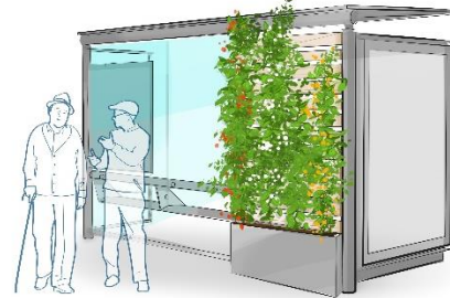
Abribus avec paroi arrière végétalisée